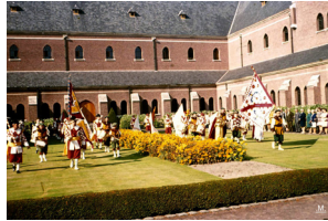
De gilden brengen een vendelhulde aan de kloostergemeenschap.