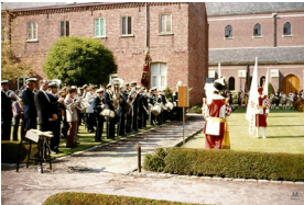
De Koninklijke Fanfare Philharmonie speelt voor de feestende gemeenschap.